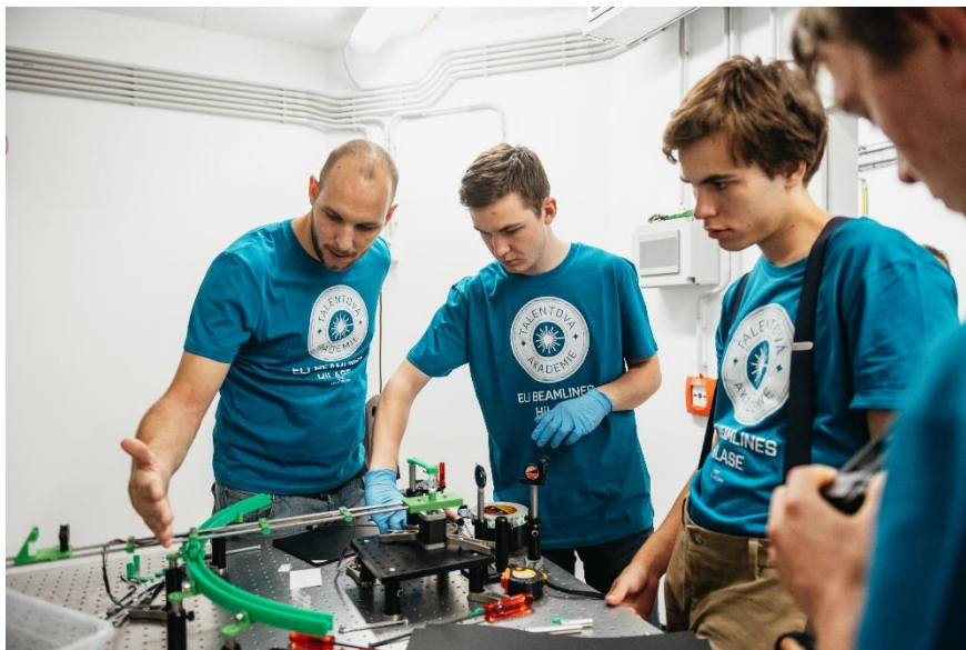
Stavba laserového set-upu (Talentová akademie 2022)