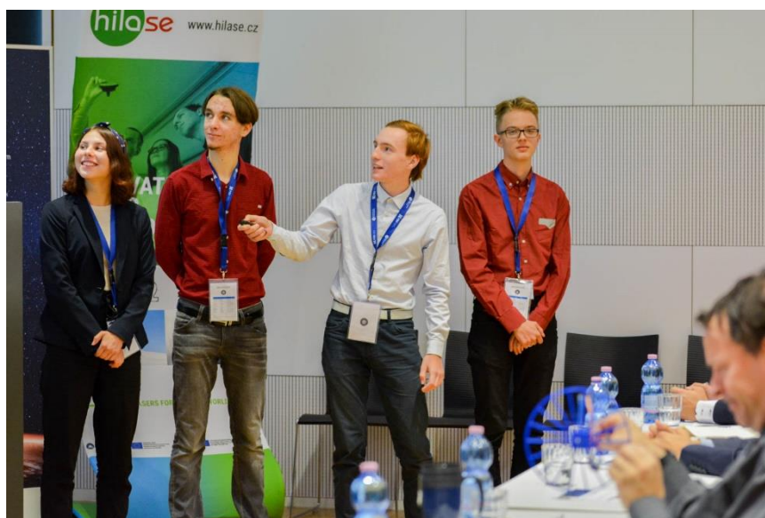
Závěrečná studentská konference (Talentová akademie 2022)