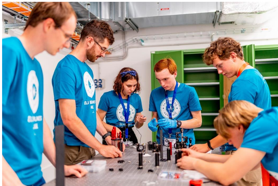
Lasarový workshop (Talentová akademie 2022)

Obrazová příloha: Fotografie v plném rozlišení jsou k dispozici na bit.ly/TalentovkaMedia