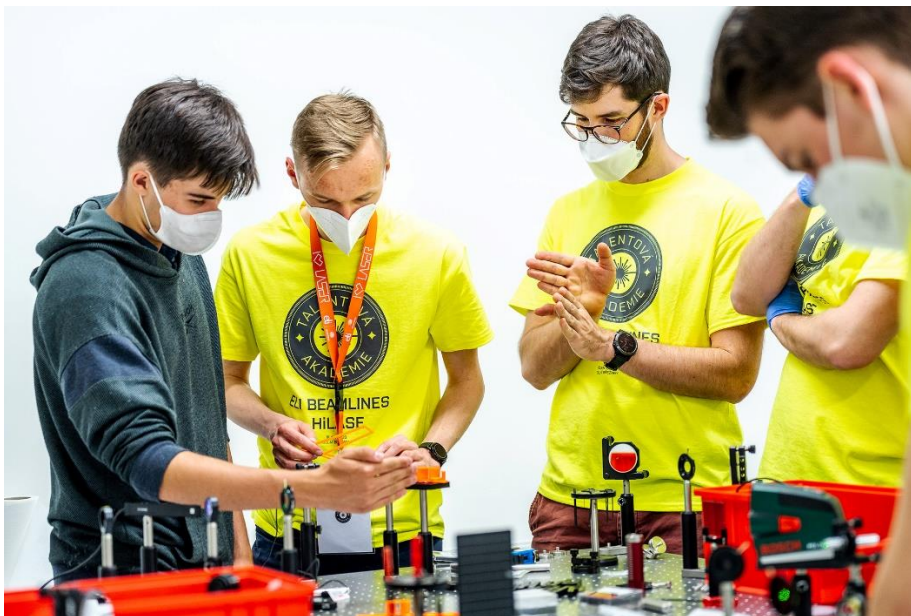
Lasertový workshop (Talentová akademie 2020)

Obrazová příloha: Fotografie v plném rozlišení jsou k dispozici na bit.ly/TA2022_media