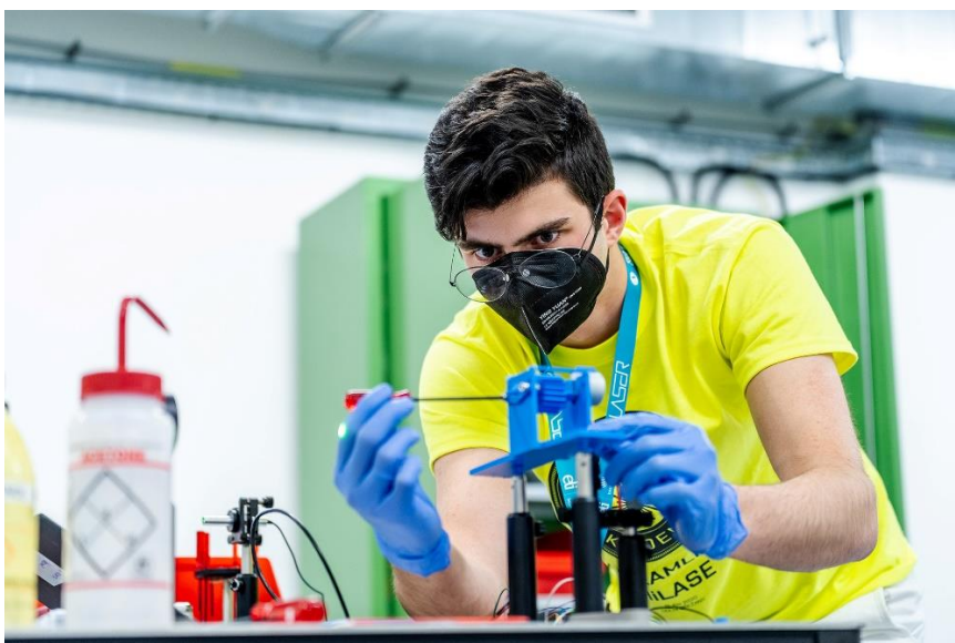
Příprava laserového set-upu (Talentová akademie 2020)