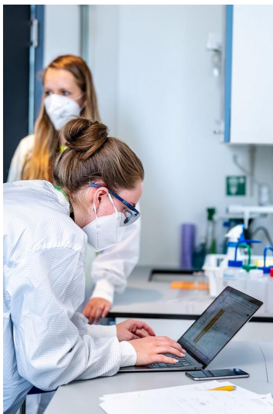
Chemická laboratoř (Talentová akademie 2020)