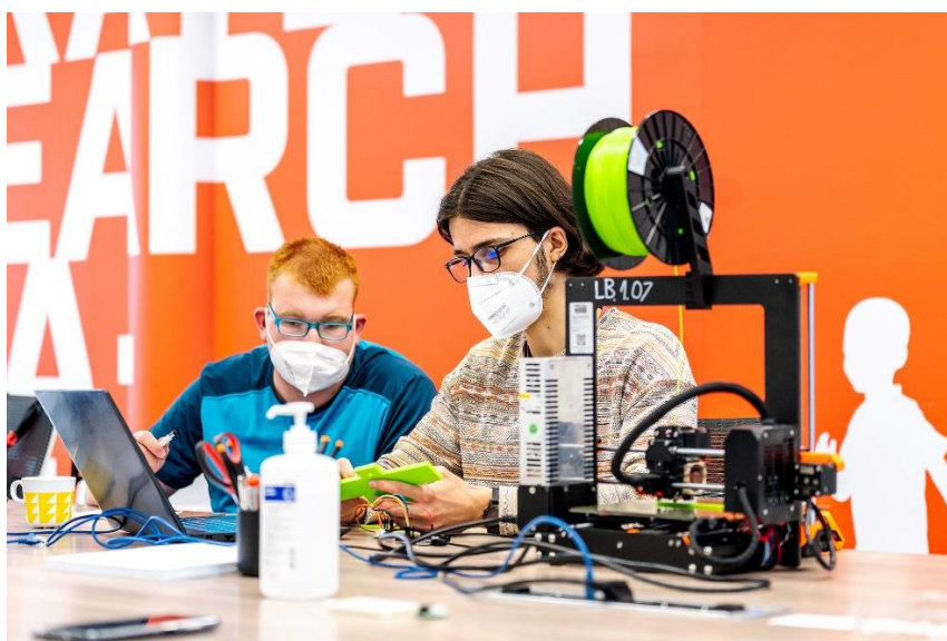
3D tisk a konstrukce (Talentová akademie 2020)